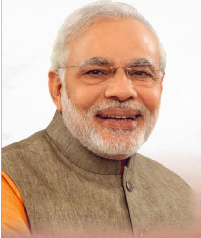
श्री नरेन्द्र मोदी प्रधानमंत्री